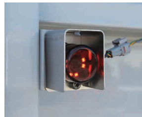
警告インジケータ(注意<橙>)

ブレーキシューの温度変化から異常を検知し、サイドミラーを通してドライバーへお知らせ。