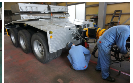
ポールトレーラの整備