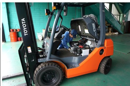
フォークリフトの年次点検