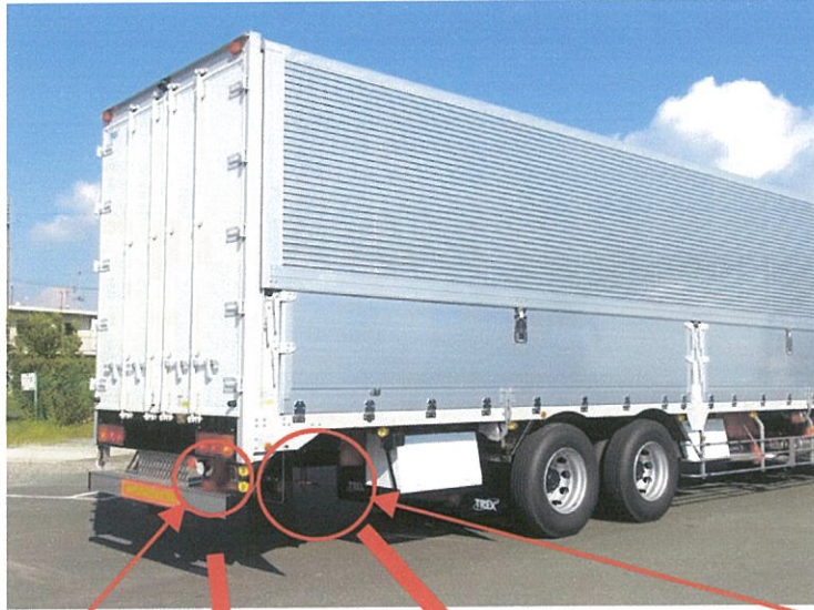
羽根開閉スイッチ