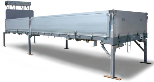
クレーン荷役に最適でマルチに使用可能な