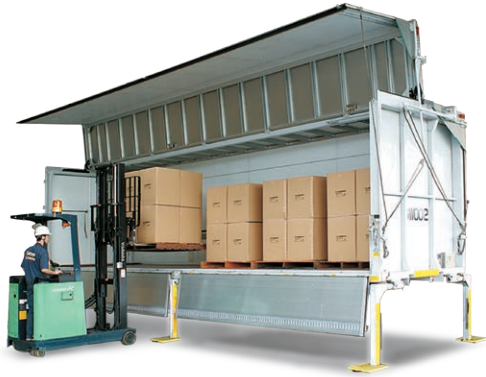
動力源を必要とせずボデー単体でウイングの開閉が可能な

バンボデーの他、お客様のニーズに合わせて様々なボデーを設定。 用途別に形状の異なるボデーを組み合わせることで、柔軟なシステムを構築することが可能です。