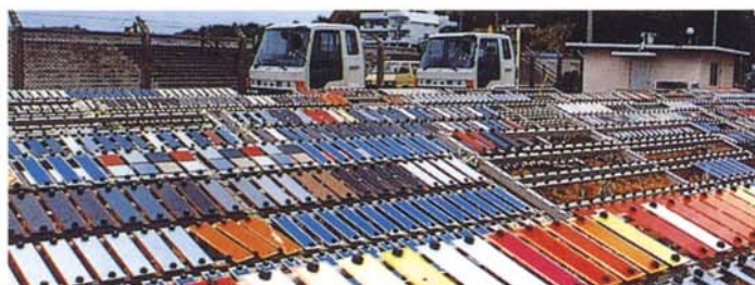
屋外暴露試験風景 (沖縄)

また、使用する素材も黒皮付鋼板から酸洗鋼板に変更し、塗膜性能及び外観性の向上を図り、従来のスプレー塗装に比較して約2倍以上に防錆性能が向上しました。(当社従来の吹付塗装仕様とのテスト比較値です)