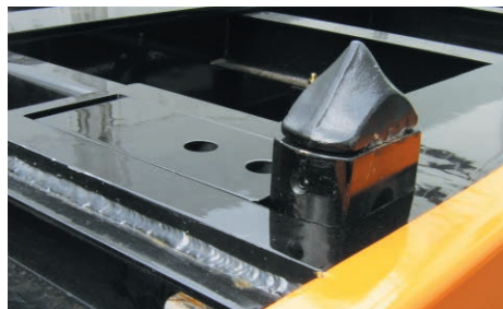
収納式ツイストロック(フタ有)