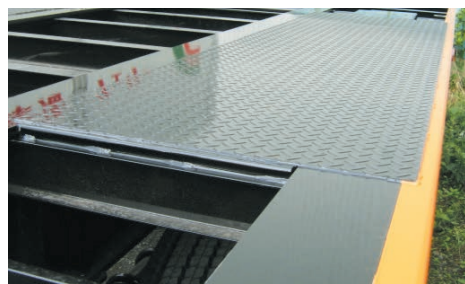
床一部分張り 縞鋼板