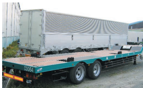
床板 全面張り アピトン